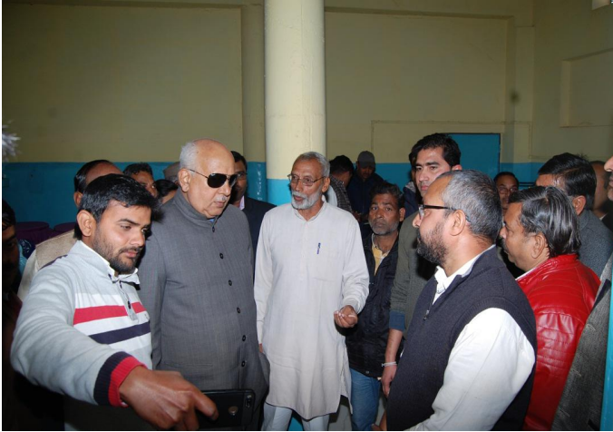
SHREE. SOORYAPRATAP SHAHI JI KRISHI MANTRI