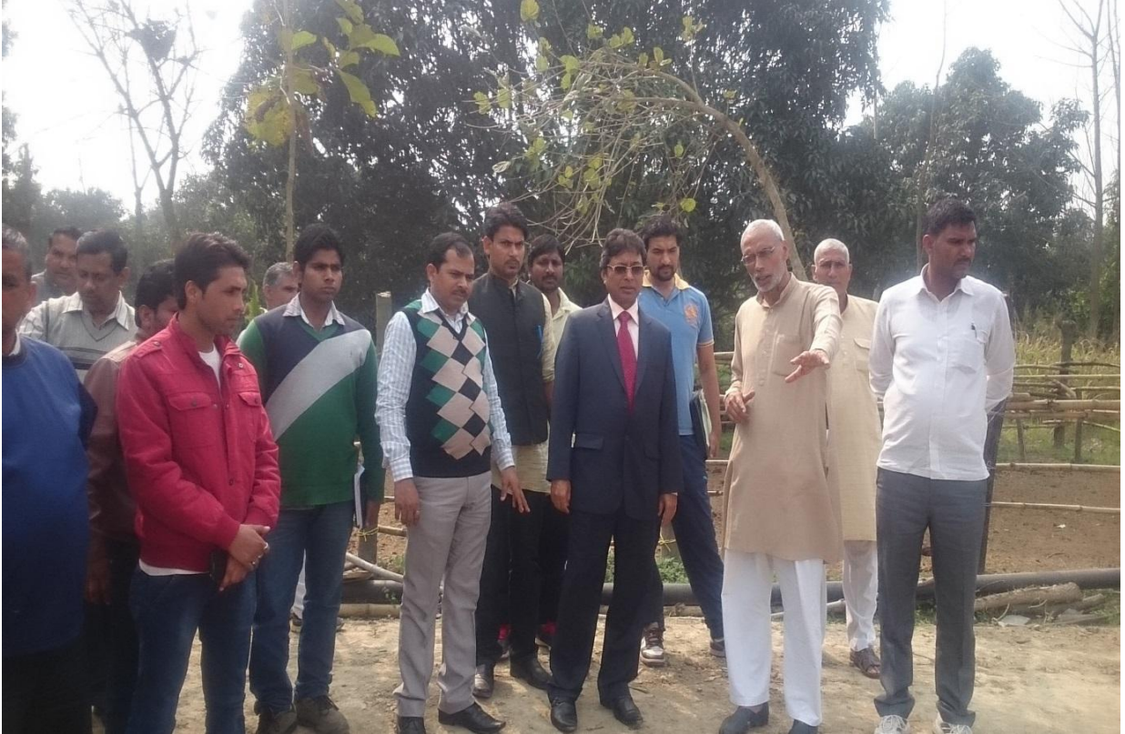
SHREE. MAHA MAHIM ARIF MOHAMMAD KHAN JI ( GOVERNOR OF KERALA )